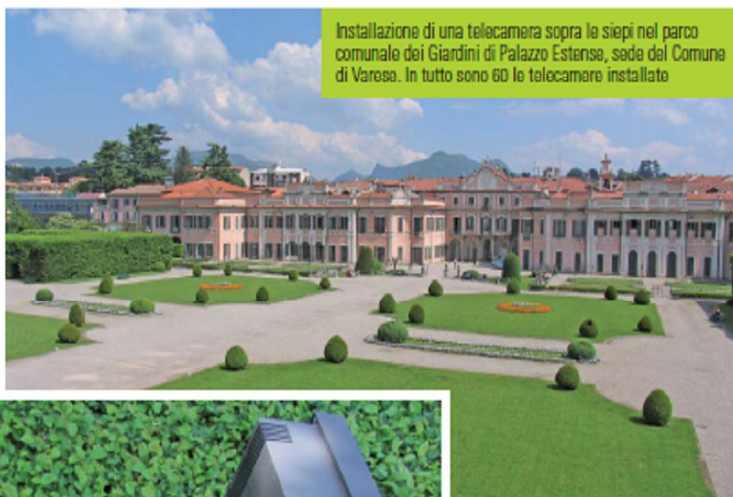
Installazione di una telecamera sopra le siepi nel parco comunale dei Giardini di Palazzo Estense, sede del Comune di Varese. In tutto sono 60 le telecamere installate